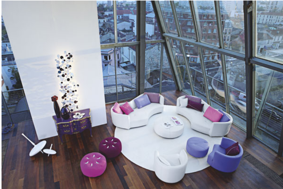
图示：Tangram 沙发系列，设计师：Assmann Kleene。

Tangram 系列，模块沙发造型，提供多款摆放方式。柔和的线条，轻灵略带朦胧迷幻的紫色色系，透露愉悦的女性色彩。