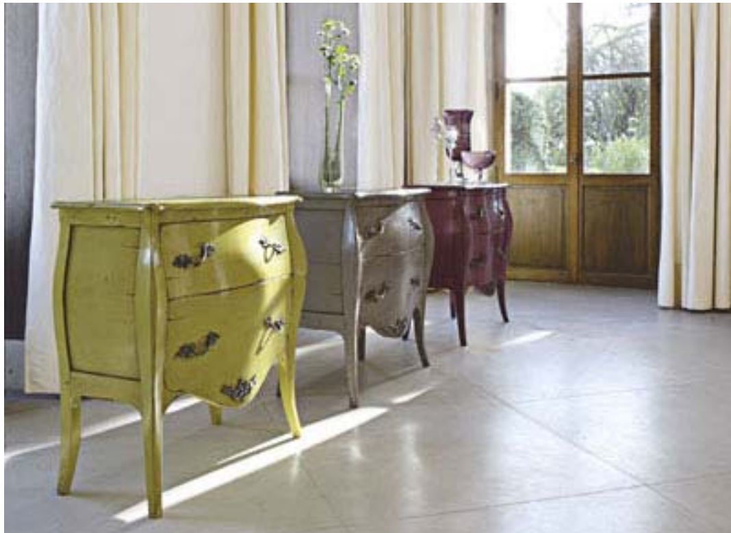
图示: Dubois 边柜

A la manière de...系列诠释了曲线与颜色的关系：实木、锻铁、青铜五金件装饰、亚麻面料等等，一切都显示女性的优雅与温柔，这个系列是对传统充满阳刚之气的古典樱桃木家具和实木地板的有趣挑战。