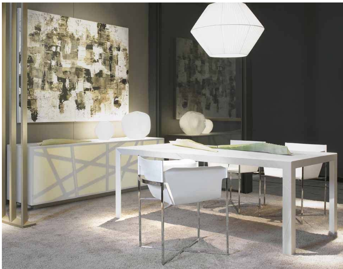
图示：Spider 系列，设计师：Daniel Rode。

“SPIDER(蜘蛛)”系列家具的特点在于造型简约，增添了材料可丽耐®的质感，精细雕刻的随机线条加剧了这一感觉。边柜的面板也有相同的雕刻花纹，强调了可丽耐®这种纯材质的半透明特质。