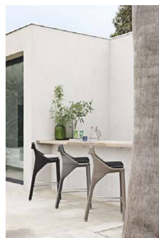
图示：Bel Air 系列，设计师：Sacha Ladic.