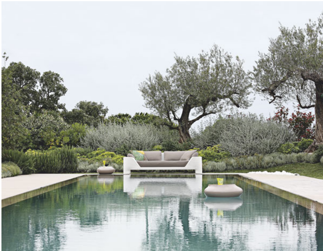
图示：Bel Air 三人沙发，设计师：Sacha Lakic；Cute Cut 茶几，设计师：Credic Ragot

BEL AIR 系列是罗奇堡推出的首个户外家具系列。整个系列包括纤细曲线造型的单椅、扶手椅和长凳，以及柳藤编织款式的组合沙发、情侣沙发，其优雅的风格适宜搭配任何一种户外环境。