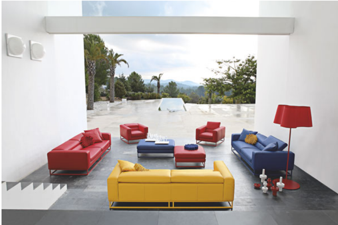
图示：Eclat 沙发系列，设计师：Philippe Bouix。

ECLAT 系列体现三原色的纯色之美，从雅致的牛皮主体部分到架空的支脚部分，都似在红黄蓝色缸中浸染过一样，纯净而震撼。其他单色的多款饰品为这个系列倍添了变化和动感。