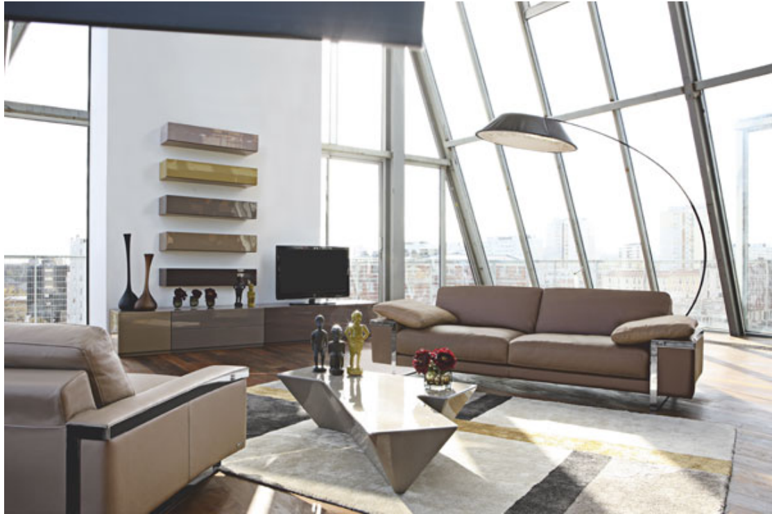
图示：Contact 厅柜系列，设计师：Luigi Gorgoni。Graphic 沙发，设计师：Philippe Bouix。

CONTACT系列证明简约之美：27 种全新颜色的Daquacryl®漆面，勾勒和创造出储物柜的线条感和几何块状。