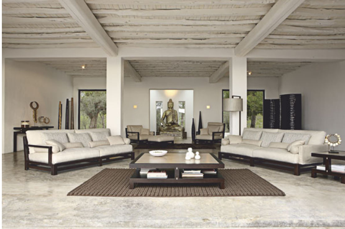
图示: Tahoma 环保沙发系列, 设计师: FabricioBallardini.

TAHOMA 系列尊崇自然环境, 创造出舒适感及和谐氛围, 且能立即融入周围环境。