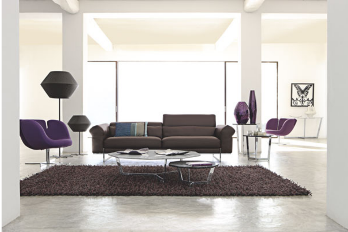
图示: Quantum 沙发系列, 设计师: Sacha Lakic。