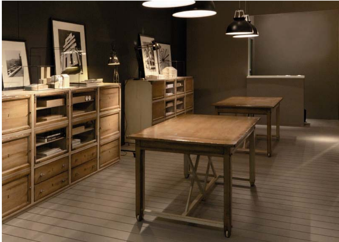
图示: Architecte 系列

ARCHITECTE 系列体现了传统手工艺家具结合现代技术的魅力。简约的线条，现代的比例和材料传达了最尖端的潮流，这款多功能家具符合当今的生活方式。